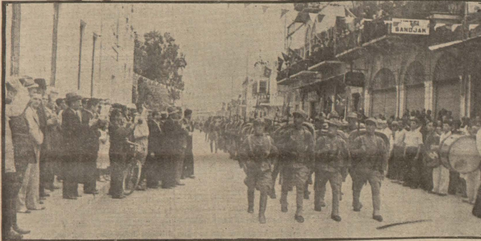
Kahraman askerler allepliler arasında Hataya girerlerken

Hatay vilâyeti teşkilât kanunu ikmal edildi. Vilâyet merkezi İskenderun oldu