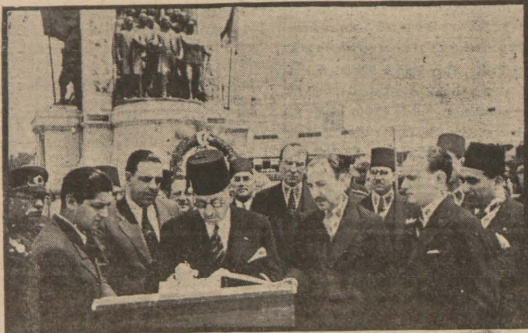
Abdülfettah Yahya Paşa abidede defteri imzalarırken

Muhterem misafirimiz yarın şehrimize dönecek ve doğrudan Romanyaya hareket edecektir